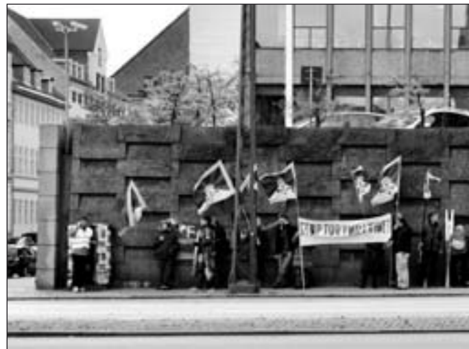
Den 19. oktober mødte udenrigsminister Villy Søvndal Kinas udenrigsminister Yang Jiechi. Støttekomiteen for Tibet demonstrerede imod Kinas overgreb i Tibet ved Udenrigsministeriet.

Generalforsamlingen sluttede cirka kl. 21:00.