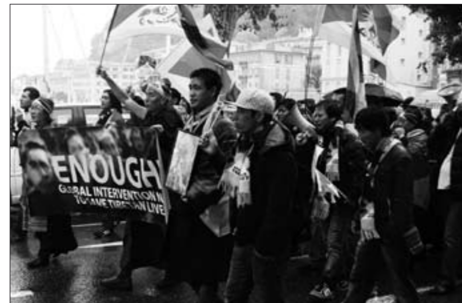
Den 4. november 2011 deltog Støttekomiteen for Tibet i en international demonstration i Nice i anledning af G20-topmødet i Cannes.

I oktober blev Jolep Dawa idømt tre års fængsel i en retssal i Barkham i Ngaba præfektur, Sichuan. Den 39-