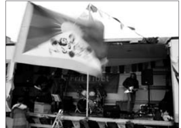
Traditionen tro holdt Støttekomiteen for Tibet den 10. marts 2011 en demonstration for at markere Tibets nationaldag. Det skete med en koncert på Nytorv med dLeap med Metta Kim Carter og Didy Levy & Same Vibration.

Det tibetanske eksilparlaments formand Penpa Tsering besøgte Danmark den 8.-11. juni. Støttekomiteen for Tibet arrangerede møder med politikere og presse. Tsering mødtes desuden med repræsentanter fra Community for Internatio-