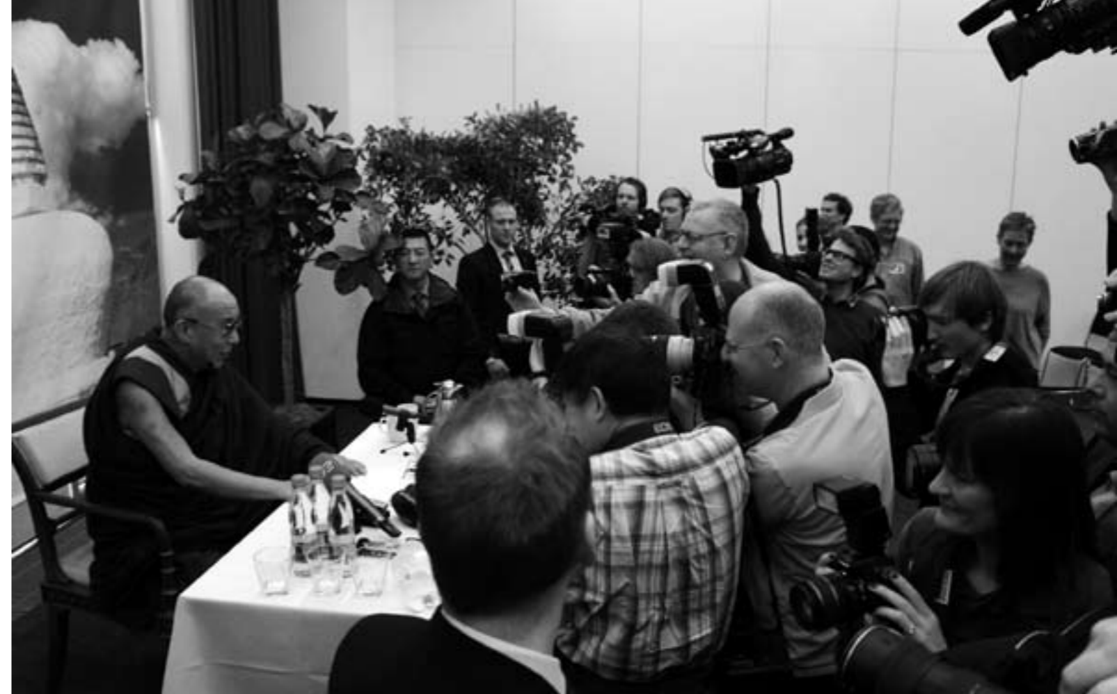
Dalai Lama til pressemøde i København den 18. april 2011.

Udstrålingslegemet er trefoldigt: a) Det højeste udstrålingslegeme som Buddha Sakyamuni, den historiske Buddha, som manifesterede de tolv buddhagerninger så som at blive født på det sted, han valgte, og så videre; b) Det kunstneriske udstrålingslegeme, som tjener andre ved at vise sig som håndværkere og kunstnere og så videre; og c) Det inkarnerede udstrålingslegeme ifølge hvilket buddhaerne viser sig i forskellige former så som mennesker, guder, floder, broer, medicinske planter og træer for at hjælpe levende væsener. Af disse tre typer af udstrålingslegemer kommer reinkarnationerne af åndelige mestre, der er anerkendt og kendt som tulkuer i Tibet, ind under den tredje kategori. Blandt disse tulkuer kan der være mange, der er virkelig kvalificerede inkarnerede udstrålingslegemer af buddhaerne, men dette gælder ikke nødvendigvis dem alle. Blandt tulkuerne i Tibet kan der være nogle, der er inkarnationer af højere bodhisattvaer, bodhisattvaer på vejene for akkumulering og forberedelse, såvel som mestre, der tydeligvis stadig har til gode at træde ind på disse bodhisattvaveje. Derfor gives titlen tulku til inkarnerede lamaer enten på grund af deres