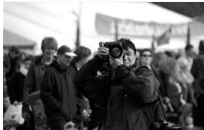
Ulovlig kinesisk efterretningsvirksomhed i Danmark? Det er tit at vi bliver fotograferet af kinesere, når vi laver offentlige arrangementer. Dette foto tog vi den 1. maj 2010, hvor vi havde en bod i Fælledparken

Den 1. maj havde vi en bod i Fælledparken, hvor vi delte informationsmateriale ud og solgte ting fra vores butik.