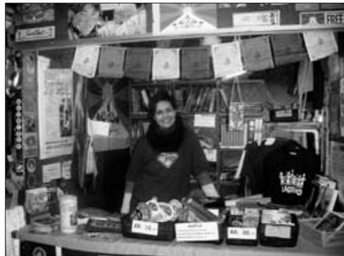
Støttekomiteens bod på Christianias julemarked 2010.