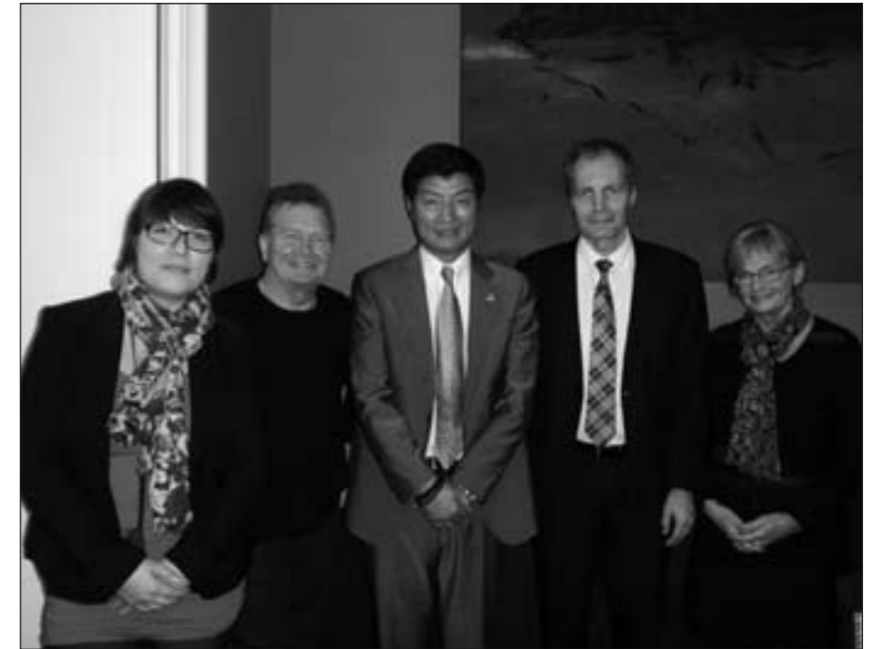
Støttekomiteen for Tibet arrangerede den 25. november et møde for Tibets nyvalgte premierminister Lobsang Sangay med medlemmer af Folketinget.

Uddannelse vil være vores prioritet nummer 1. Som Hans Hellighed Dalai Lama har lært os, er deling af viden „en måde at opnå udødelighed på“. Det er den fakkell, der vil oplyse Tibets